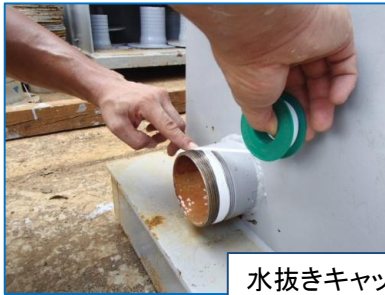
水抜きキャップを締める前に、ニップル部に時 計回りにシールテープを強めに巻き付ける。

水槽タンク1台につき、水抜き口(3B雄ネジ)がついております。 水抜き口のキャップの締め方について、お問い合わせが多かったのでご案内いたします。 ※水抜きキャップを締めずに出庫している商品もございますので、使用前に 締まっているか、ご確認ください。(シールテープは御用意ください)