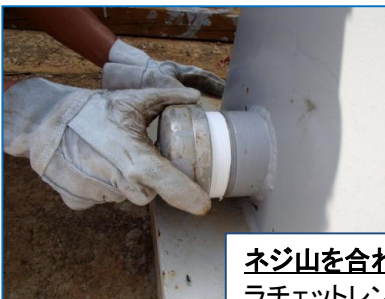
ネジ山を合わせて、手で締め込んだ後、 ラチェットレンチ・スパナなどで締め込む。